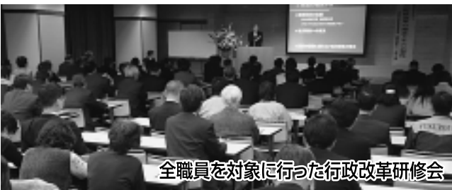
全職員を対象に行った行政改革研修会