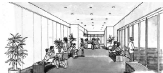
ホワイエのイメージ図 (※)ホワイエ...ホールへ出入りする際の混雑を避けるために設けた広間。日常はロビーとして使用。

市民の皆さんが自由に集うことができるテラスや小規模な野外イベント、朝市などができる中庭があります。