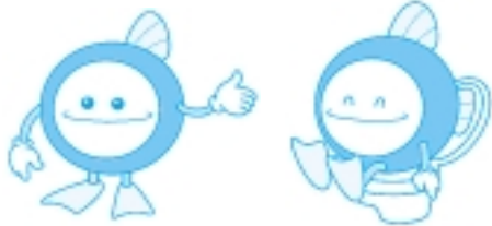
下水道マスコットキャラクター スイスイくん