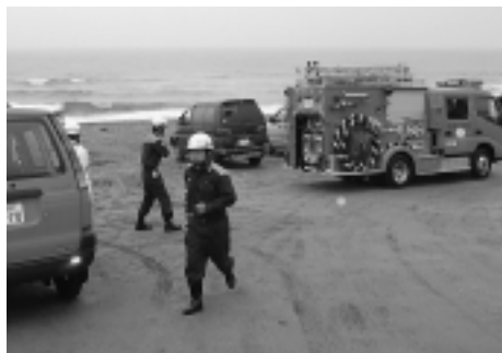
2007年末に完成予定です。 津波防災の意識高める

7月7日、浅羽海岸で、津波による被害を防止するため、津波避難訓練を行いました。 津波注意報が発表されたことを想定し、市や消防、警察の連携体制や情報伝達を確認。海岸利用者に、チラシを配ったり、避難誘導を行ったりして、津波に対する注意を呼び掛けました。