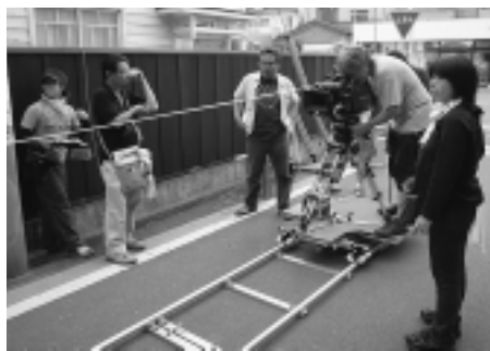
市内で映画撮影が行われました

7月7日、浅羽海岸で、津波による被害を防止するため、津波避難訓練を行いました。 津波注意報が発表されたことを想定し、市や消防、警察の連携体制や情報伝達を確認。海岸利用者に、チラシを配ったり、避難誘導を行ったりして、津波に対する注意を呼び掛けました。