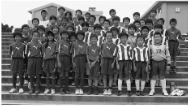
サッカーで芽生えた友情 袋井市と長野県木島平村とのサッカー少年団の交流が今年で12年目を迎えました。エコパで開催されるJリーグの前座試合で対戦したり、冬には袋井市の子もたちがスキーに訪れたりするなど、互いに地域の特色を生かし交流しています。 山名スポーツ少年団