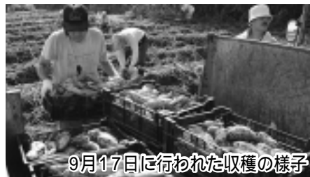
9月17日に行われた収穫の様子