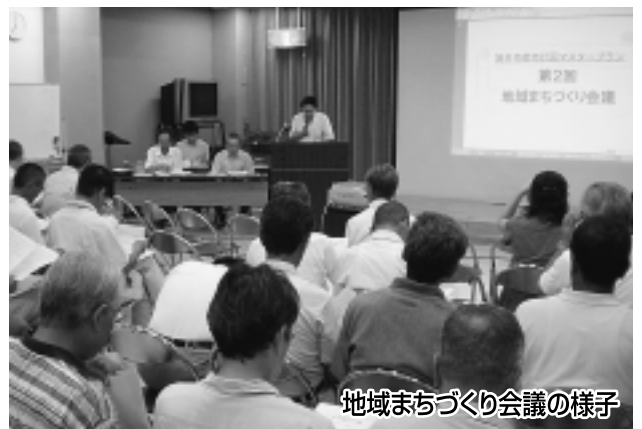
地域まちづくり会議の様子