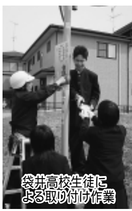
袋井高校生徒による取り付け作業

看板を設置した生徒たちは、看板を見て改めて交通安全啓発の意識を認識するとともに、今後、各クラス員に啓発し、同時に地域の交通安全にも役立って欲しいと話してくれました。