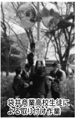
袋井商業高校生徒による取り付け作業

デザインは、磐田警察署管内の7高校がそれぞれ製作し、学校内や学校周辺の危険箇所に注意看板を設置しました。