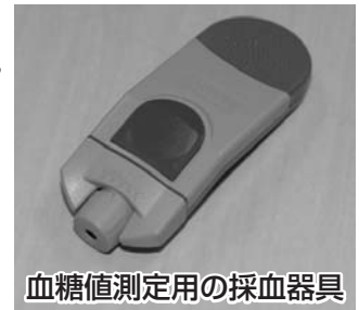
血糖値測定用の採血器具

☎☎健康づくり政策課健康指導1係（袋井保健センター） ☎42-7275 ✉kenkoudukuri@city.fukuroi.shizuoka.jp