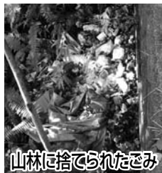
山林に捨てられたごみ

市内でも、山林や海岸などの人目に付きにくい所に捨てられた電化製品や自動車部品などの粗大ごみの不法投棄が見られます。