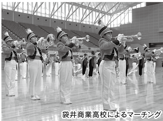
袋井商業高校によるマーチング