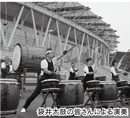
袋井太鼓の皆さんによる演奏