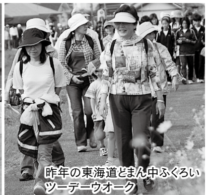
昨年の東海道とまん中ふくろいツデーウォーク