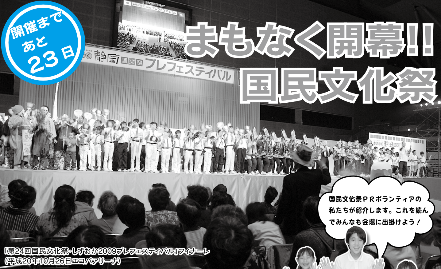
「第24回国民文化祭・しずおか2009プレフェスティバル」ファイナーレ (平成20年10月26日エコパアリーナ)

国民文化祭PRボランティアの 私たちが紹介します。これを読んで みんなも会場に出掛けよう!