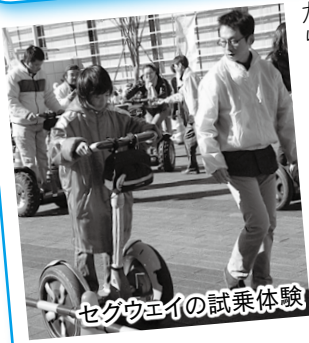
セグウェイの試乗体験

こども遊び広場 日 10月31日(土)、11月1日(日) 時 午前10時～午後4時 所 屋外スペース 伊豆サイクルスポーツセンタ-の「変わり種自転車」30台がエコパに登場。1人乗りから2、3人乗りなど、いろいろ