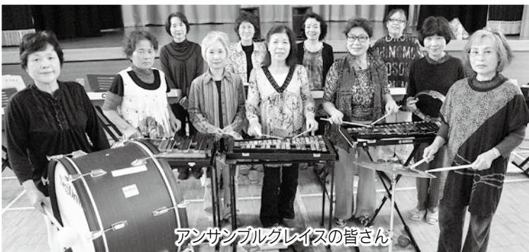
アンサンブルグレイスの皆さん