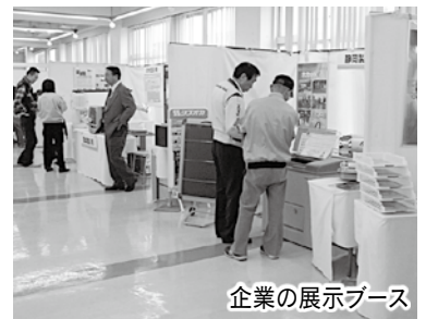
企業の展示ブース