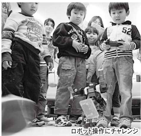
ロボット操作にチャレンジ