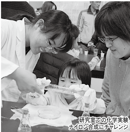
研究室での化学実験 ナイロシ合成にチャレンジ