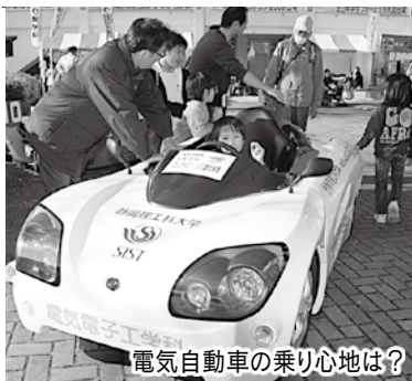
電気自動車の乗り心地は?