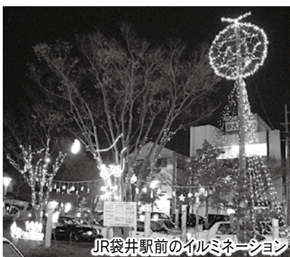
JR袋井駅前のイルミネーション

市民やバス・電車の乗降客などに冬の電飾を楽しんでもらおうと袋井駅前商店街協同組合が設置したものです。イルミネーションは1月15日まで毎夜点灯し、袋井のまちを彩ります。