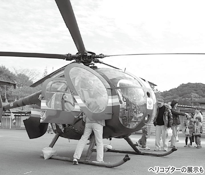
ヘリコプターの展示も