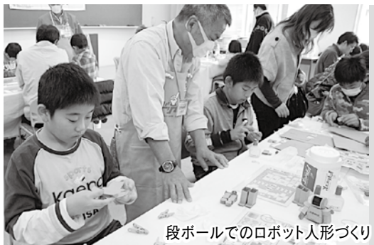
段ボールでのロボット人形づくり

術や製品などを紹介。電動自転車やロボットなど理工科大学の研究成果発表や、子どもたちが科学や工作体験ができる体験コーナーも開設され、訪れた皆さんは楽しみながら様々なものづくり体験に挑戦しました。