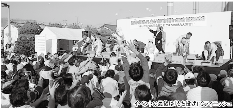
イベントの最後は「もち投げ」でフィニッシュ