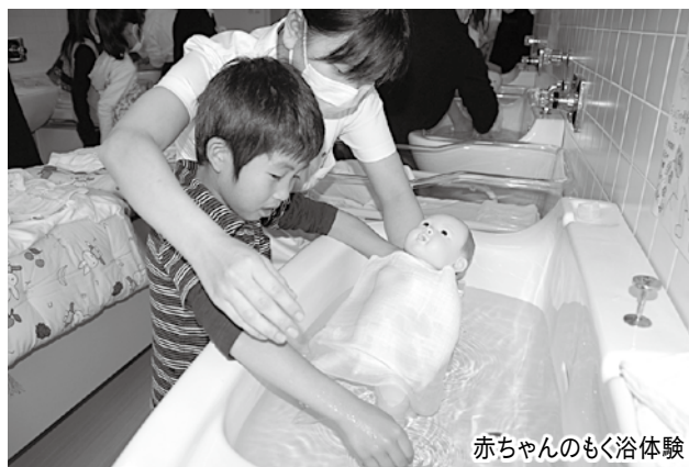
赤ちゃんのむく浴体験

会場を訪れた皆さんは、学生たちに看護や健康増進のポイントなどを分かりやすく教えてもらいながら、展示や体験を楽しみました。