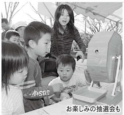
お楽しみの抽選会も