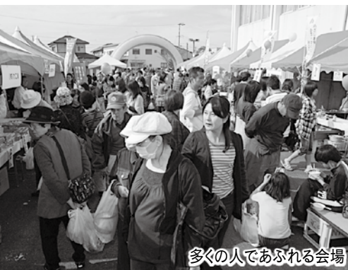
多くの人であふれる会場