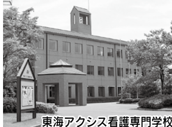
東海アクシス看護専門学校

〒437-0033 袋井市上田町267-30 http://www4.tokai.or.jp/axis-ns/