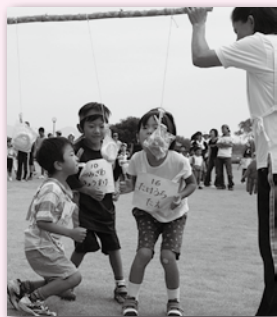
ミニ運動会(第7回) パンくい競争