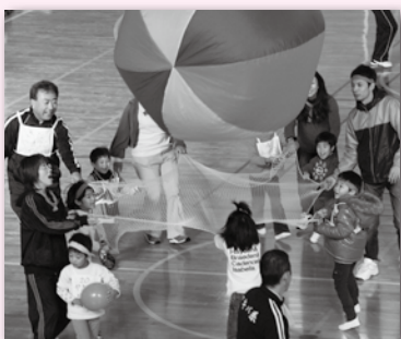
大きなボール運び競争(第10回)