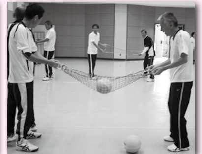
ネット・バス・ラリー

◇岡山で生まれ、大阪で競技人口が急増し、日本全国に普及しつつある「ディスコン」の講習会も行いました。