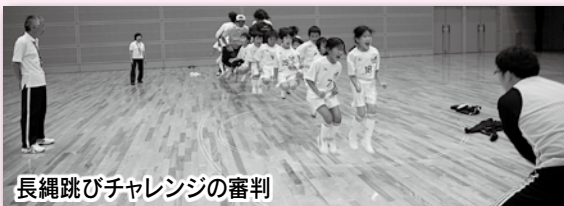
長縄跳びチャレンジの審判