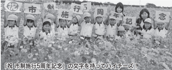
「祝 市制施行5周年記念」の文字を持ってハイチーズ!