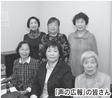
「声の広報」の皆さん

◇昭和53年から永年にわたり、市の広報紙などをカセットテープに朗読し、視覚に障害のある方へ情報を送る活動をしている「声の広報」の皆さんに「緑綬褒章」が贈られました。