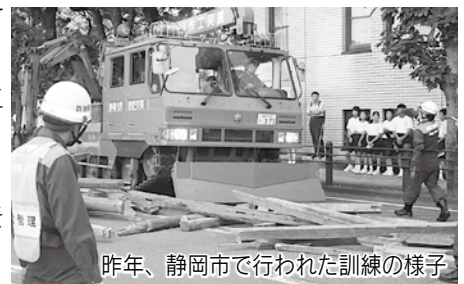
昨年、静岡市で行われた訓練の様子