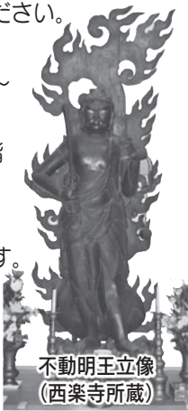
不動明王立像 (西楽寺所蔵)