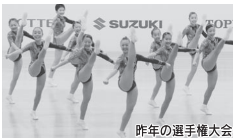
昨年の選手権大会