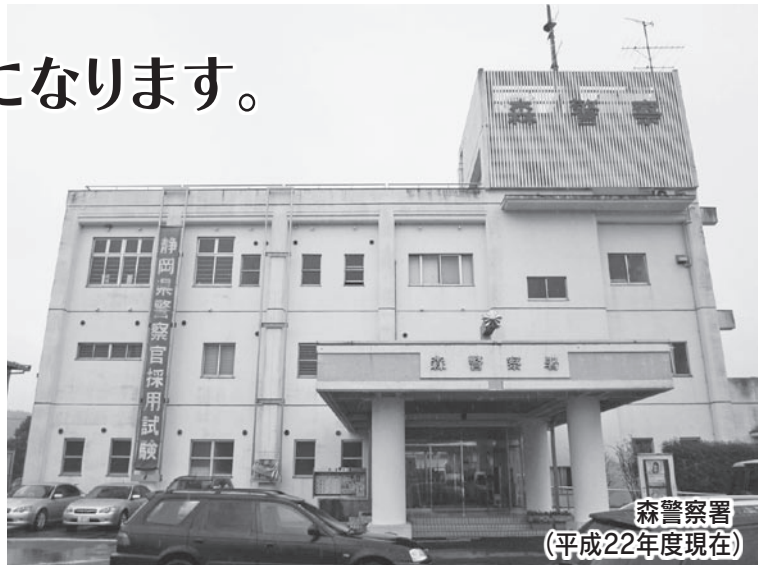
森警察署 (平成22年度現在)