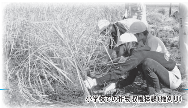
小学校での作物収穫体験(稲刈り)