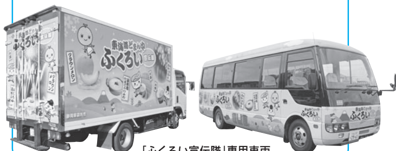
「ふくろい宣伝隊」専用車両