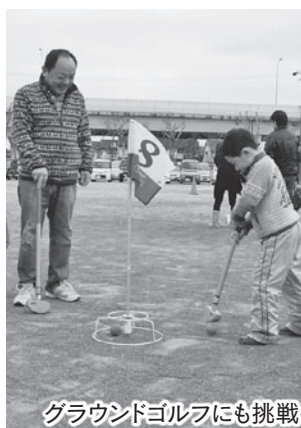
グラウンドゴルフにも挑戦