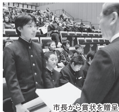
市長から賞状を贈呈

全国や県などで開催された大会やコンクールで優秀な成績を取めたり、善行に努めたりした児童・生徒一人ひとりに、市長が賞状を贈呈。市長や教育長が「素晴らしい活躍ですね。今後ともさらに活躍されることを期待します」と称えました。