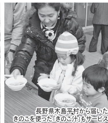
長野県木島平村から届いたきのこを使った「きのこ汁」もサービス