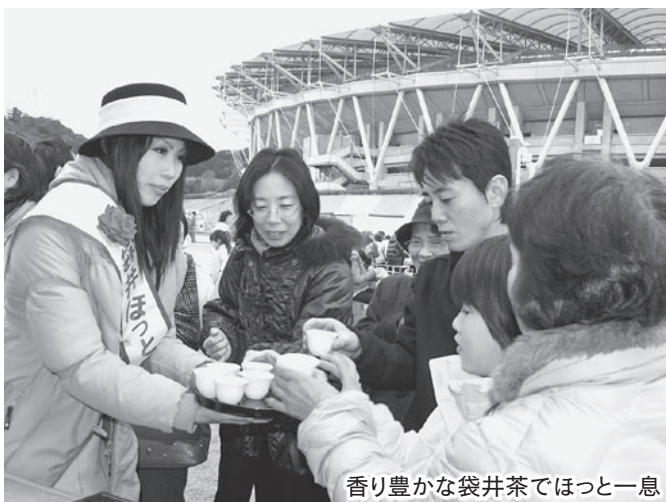
香り豊かな袋井茶でほっと一息