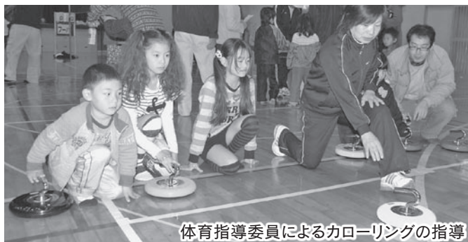
体育指導委員によるカローリングの指導