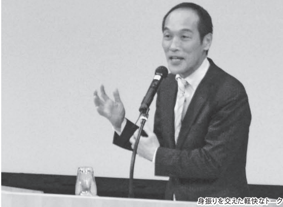
身振りを交えた軽快なトーク