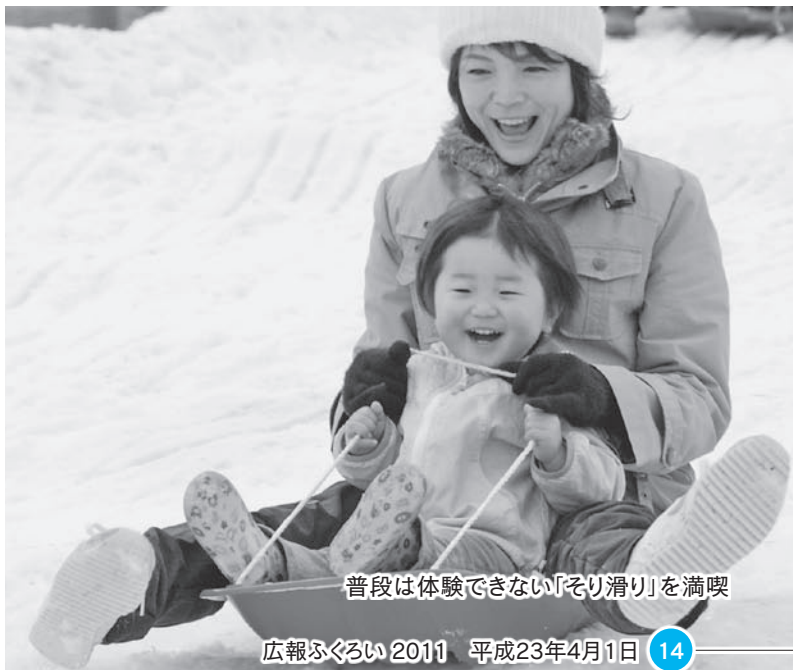
普段は体験できない「そり滑り」を満喫