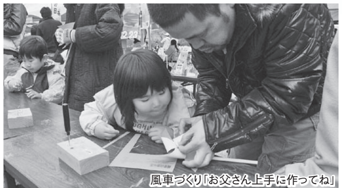
風車づくり「お父さん上手に作ってね」

また、袋井茶の振る舞いや、たまごふわふわなどのB級グルメの販売も行われるなど、来場者は、きれいに花をつけた300本の梅を楽しみながら、食文化に触れていました。