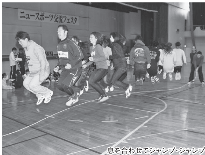
息を合わせてジャンプ・ジャンプ

また、会場に設けられた特設広場には、NPO法人袋井スポーツコミュニケーションが、長野県木島平村と連携して、雪を運び込み、参加した皆さんは、雪で遊んだり、長野県産きのこを使ったきのこ汁を味わったりして、楽しそうに過ごしていました。