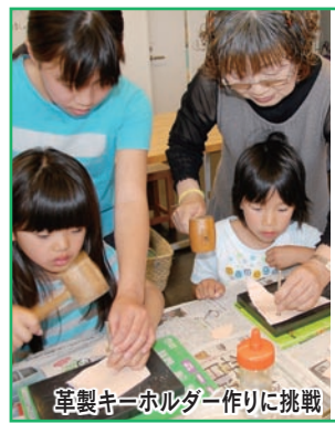
筆製キーホルダー作りに挑戦

市の木・花・鳥それぞれの特徴を見やすくシンプルに表現し、「FUKURŌ」の「F」を図案化しました。