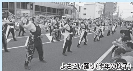
よさこい踊り(昨年の様子)