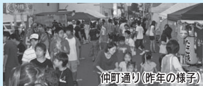
仲町通り(昨年の様子)