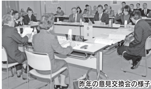
昨年の意見交換会の様子

◇市が行っている事業について、市民の目線から意見や評価をいただき、事業をより効果的に行う方法などを公開の場で議論する「意見交換会」の市民委員を募集します。