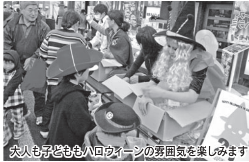
大人も子どももハロウィーンの雰囲気を楽しみます