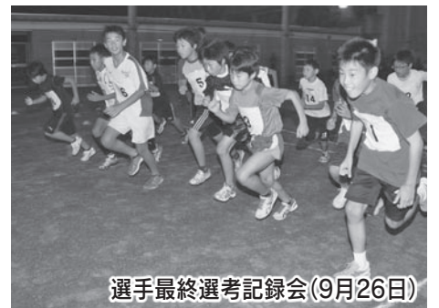
選手最終選考記録会(9月26日)

◇県内35市町から39チームが出場する「第12回静岡県市町対抗駅伝競走大会」。 袋井市のゼッケンナンバーは「22」で、1区は1列目のセンターからスタートします。 皆さんの熱い声援をお願いします。 日時 12月3日(土) 午前10時～ コース 県庁～駿府公園～長谷通り～麻機街道～流通センター前通り～北街道～清見寺～南幹線～草薙陸上競技場(42.195km) ◇大会の様子は、テレビとラジオで生中継されます。 ▽SBSテレビ…午前9時30分～午後0時50分 ▽SBSラジオ…午前9時45分～午後1時 問合せ スポーツ協会 ☎42-1920