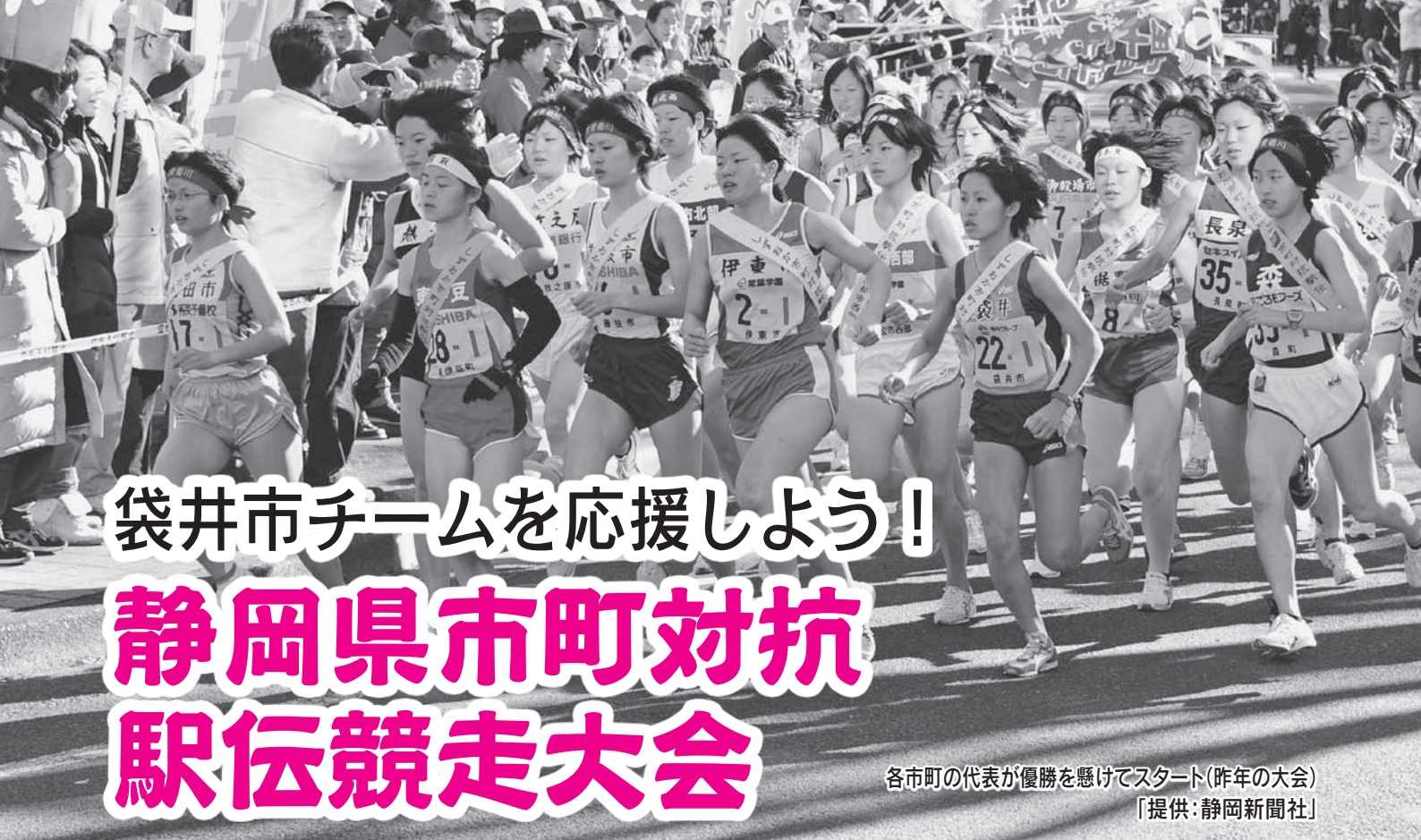
各市町の代表が優勝を懸けてスタート(昨年の大会)