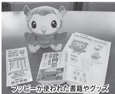
フッピーが使われた書籍やグッズ