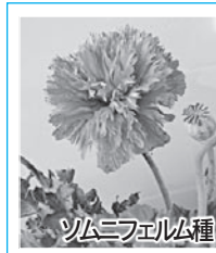
ソムニフェルム種

◇鮮やかなピンク色の八重咲きが多い。一重咲きは花びらが4枚で色は赤、桃、紫、白など。