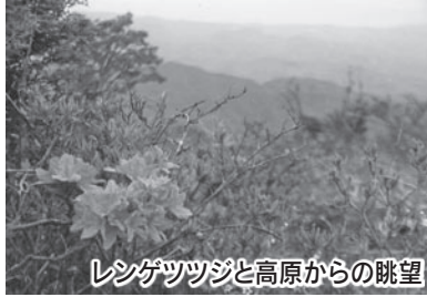
レンゲツツジと高原からの眺望

ここからの眺望は素晴らしい、山頂からは、北アルプスの山々をはじめ、諏訪湖、南アルプス、富士山まで、360度の大パノラマの景色を存分に楽しむことができます。「日本のシャッターポイント」とも言われ、全国からたくさんのカメラマンが写真を撮りに訪れます。