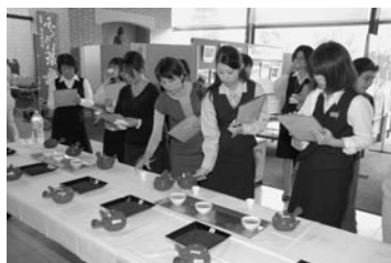
昨年の二次審査の様子