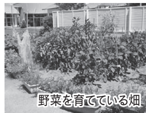
野菜を育てている畑

「子どもたちが大きくなった時、芝生の園庭のことを思い出してくれば、こんなにつれいことはありませぬ」