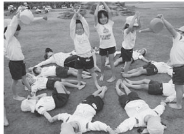
「大きな花をつかったよ」

ガラスが落ちていないかどうかということ。子どもたちは、自分から石拾いをしてきています。自分たちの環境は自分たちでつくるという気持ちが根付き、成長の糧となっています。」