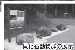
貝化石動物群の展示