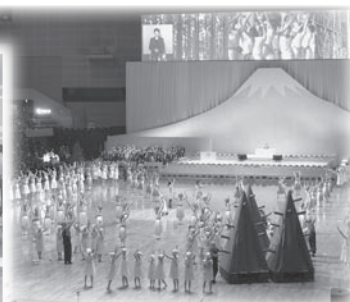
袋井東小学校の児童も参加したメインテーマアトラクション「Forest Life ~森と妖精の物語~」