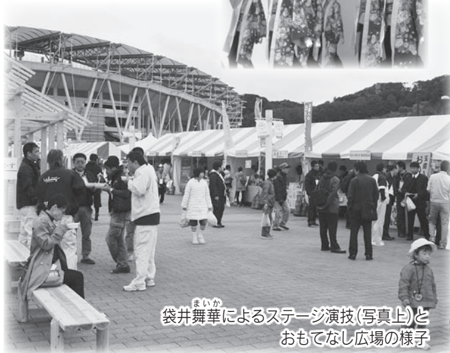
まいか 袋井舞華によるステージ演技(写真上)とおもてなし広場の様子

11月10日・11日の2日間、森林を守り・育て・活かすことを目的に、「第36回 全国育樹祭」がエコパアリーナを中心に開催されました。多くの市民の皆さんが、様々なかたちで育樹祭に関わり、全国から袋井市を訪れた方たちをおもてなしするとともに、市の魅力をPRしました。 ☎農政課農業振興係 ☎44-3133