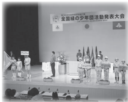
メロープラザでの活動発表

11月10日、メロープラザで「全国緑の少年団 活動発表大会」が開催され、全国から集う15の少年団を代表して、5つの団体が日ごろの活動の成果を発表しました。 発表に先立ち、笠原小学校の和太鼓演奏が、来場者を温かくお出迎えしました。