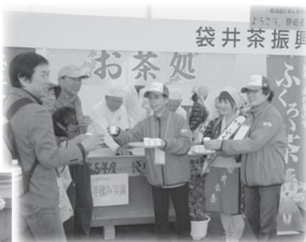
袋井茶振興協議会による手揉み実演とふくろい茶のサービス

11日には、エコパスタジアム前のエントランス広場で「おもてなし広場」も催されました。 会場内では、県内の特産品やご当地グルメ、各種森林体験コーナーなど100を超える出展ブースや、ステージ演技が来場者の皆さんをもてなすとともに、静岡県の魅力をPRしました。