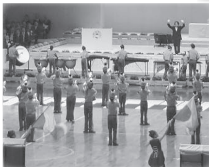
袋井南小学校「South Winds」によるマーチング演奏

11月11日、エコパアリーナで式典行事が開催され、皇太子殿下にお言葉をいただくとともに、各種表彰やメインテーマアトラクションなどが行われ、約7,500人の参列者が、森林を守り育てる意識を新たにしました。 式典では、市内の児童が歓迎演奏や皇太子殿下のお出迎え・お見送り、メインテーマアトラクションなどで活躍しました。