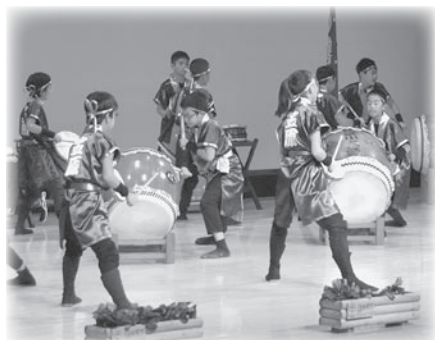
笠原小学校児童による和太鼓演奏