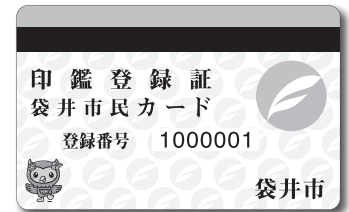
市民カードイメージ図