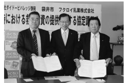
㊚ 防災課防災計画係 ☎44-3360

◇株式会社ガイドーピバレッジ静岡とフクロイ乳業株式会社の両社が保有するペットボトル飲料を、災害時に提供していただけることになり、平成24年12月18日に協定を締結しました。これにより、500mlペットボトル飲料17,600本が確保できました。