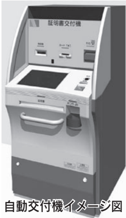
自動交付機イメージ図