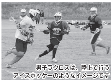
男子ラクロスは、陸上で行うアイスホッケーのようなイメージです

2月18日から原野谷川親水公園をサブ会場に開催されている「ラクロス・スプリング・キャンプ」取材してきました。私も大学時代にラクロスをやっていましたが、県内にはチームが少ないため、まだまだ知らない方も多いのではないのでしょうか？●エアロビックスやクラウンメロンマラソンのように、ラクロスも袋井に定着してくれるといいなあ●「は」