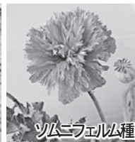
ソムニフェルム種