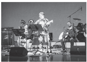
ホールでバンド演奏披露

地域に新たな文化をつくる事業として、現在、多機能ホールの活用を支援中です。平成24年度には「アマチュアバンド・フェスティバル」や「クローバーコンサート」を実施しました。