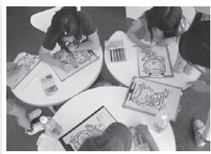
くつろぎスペース