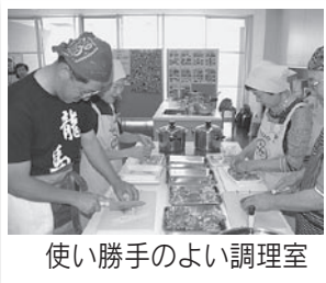
使い勝手のよい調理室

メローカレッジでは、平成24年度・65講座を実施。多くの方に来ていただけるように、夜間や土日の講座を多くしたり、市民講師の発掘に力を入れています。