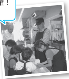
講座で活躍！ 食工房

講座でも利用する調理室は、利用者が主体となつて、使用方法を検討する委員会を定期的に実施。利用しやすい施設づくり（ひと役買って）います。