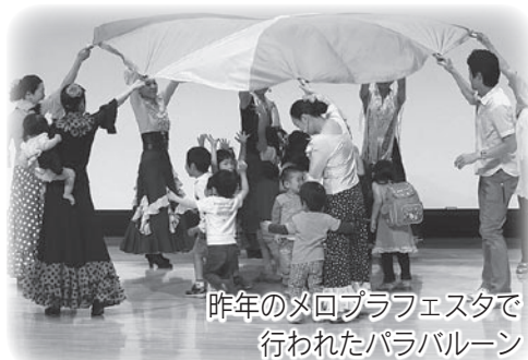
昨年のメロプラフェスタで行われたパラバルーン

「カラバーサは子どもと一緒にレッスンに参加できるフラメンコサークルです。「メロプラフェスタ」では、フラメンコ体験を予定しています。ぜひ遊びに来てね！」