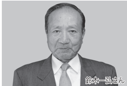
瑞宝双光章(警察功労)