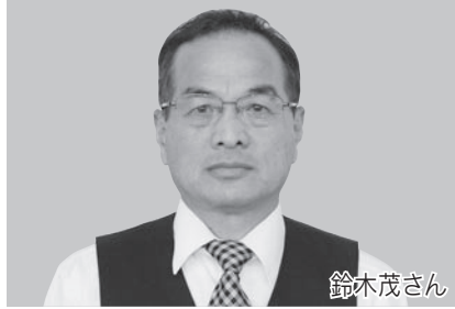
瑞宝単光章(防衛功労)

◇昭和34年から永年にわたり県警察本部などに勤務し、静岡県警視などを務め、治安維持などに貢献されました。