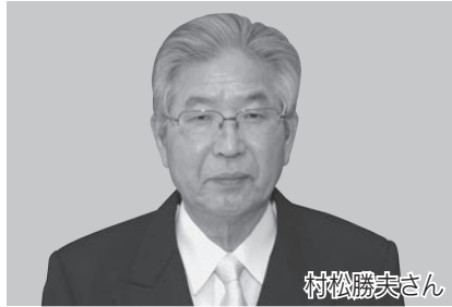
瑞宝双光章(警察功労)

◇昭和36年から永年にわたり県警察本部などに勤務し、静岡県警視などを務め、交通安全などに貢献されました。