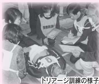
トリアージ訓練の様子