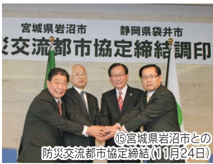
⑮宮城県岩沼市との防災交流都市協定締結(11月24日)