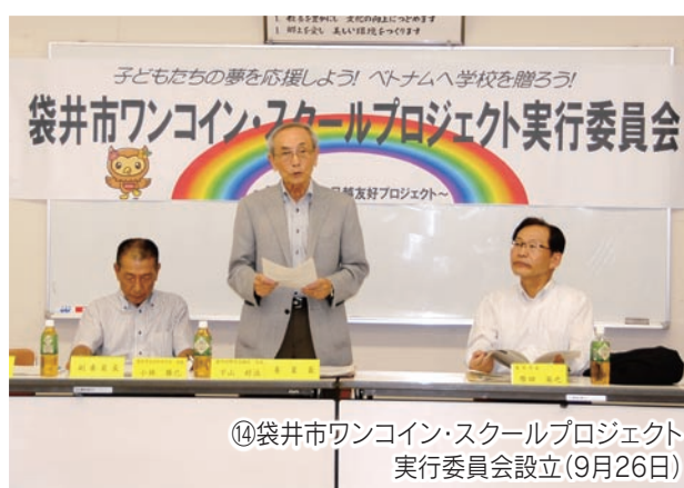
⑭袋井市ワンコイン・スクールプロジェクト実行委員会設立(9月26日)