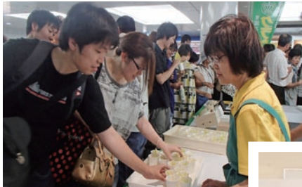
⑬「クラウンメロン」品評会in静岡市開催(8月24日)