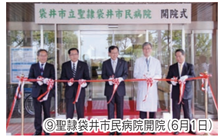
⑨聖隷袋井市民病院開院(6月1日)