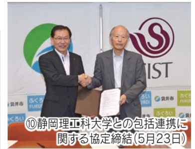
⑩静岡理工科大学との包括連携に関する協定締結(5月23日)