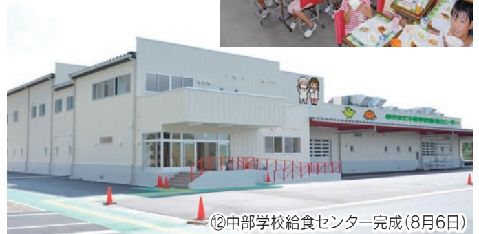
⑫中学校給食センター完成(8月6日)