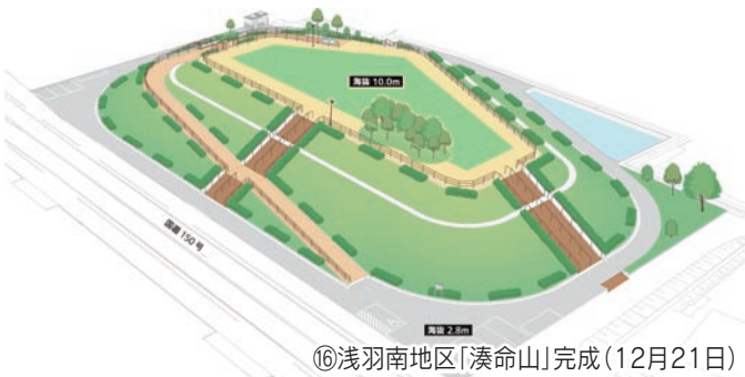
⑯浅羽南地区「湊命山」完成(12月21日)