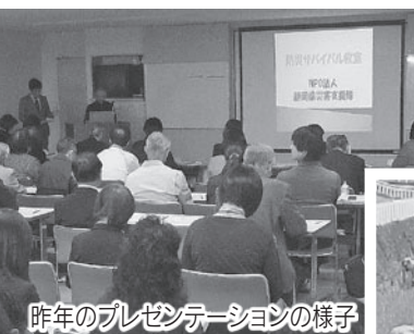
昨年のプレゼンテーションの様子

市では、市民活動団体から地域づくりや地域課題の解決などに向けた活動の提案を受け、「協働まちづくり事業」に取り組みます。皆さんからのご応募をお待ちしています。 ☎市民協働課協働推進室 ☎44-3107