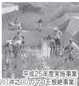
平成25年度実施事業 「油山川(沖之川)のマコモ根絶事業」