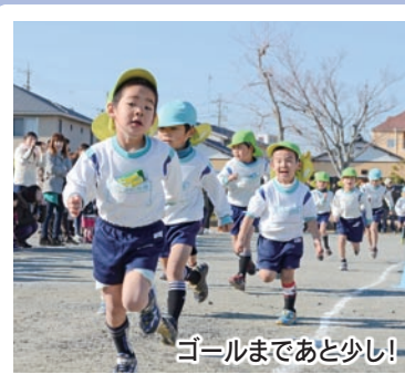
ゴールまであと少し!

1月24日、若葉幼稚園で「くすのきマラソン会」が開催され、園児178人が元気に走りました。 園児らは、先生の「がんばるぞー!」という掛け声に合わせて、「えいえいおー!」と大きな声で返事をすると、ピストルの合図とともに力強くスタート。 保護者の声援を受けながら、各学年ごとに決められたコースを完走すると、園児たちに大きな拍手が送られました。