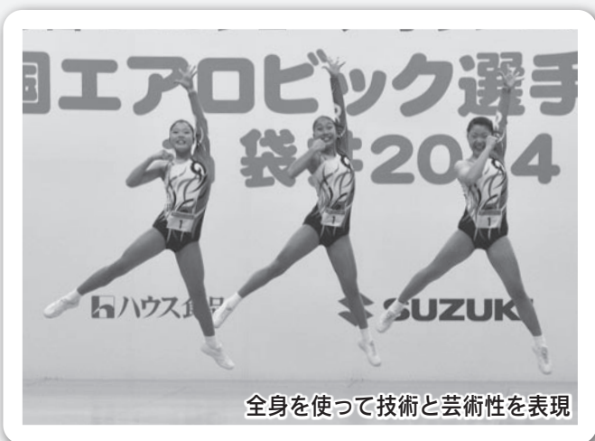
全身を使って技術と芸術性を表現

1月26日、「全国エアロビック選手権大会 in 袋井2014」がエコパアリーナで開催され、全国の予選を勝ち抜いた16歳以下のトップ選手291人が出場しました。