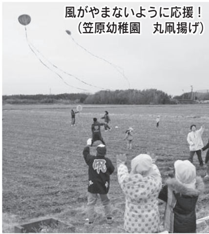
風がやまないように応援! (笠原幼稚園 丸凧揚げ)

笠原幼稚園 丸 たこ 凧揚げ、浅羽東幼稚園 親子凧揚げ大会 自慢の手作り凧、空高く揚がったよ!