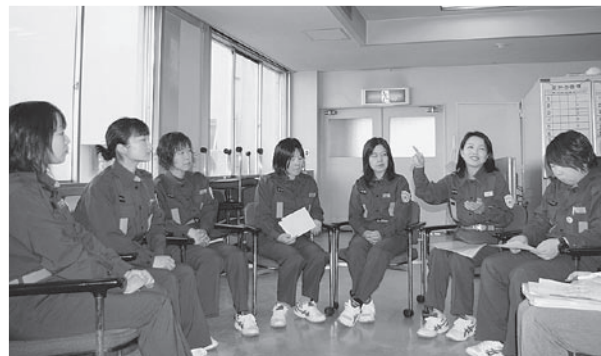
定例会議に参加した女性消防隊の皆さん

◎女性にとって災害時に声をあげるのは勇気がいりますが、自分のことを自分で解決していく姿勢が大切です。それぞれの家族構成によって、備蓄に必要なものを工夫しておくといいですよ。