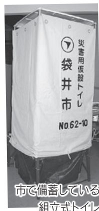
市で備蓄している 組立式トイレ