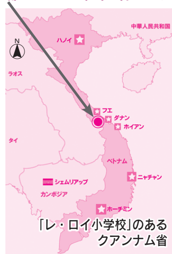
「レ・ロイ小学校」のあるクアンナム省

◇新校舎の完成により、現在分校に通っている児童が本校へ通学できるようになります。さらに、これまで教室数の不足により、半日ずつの2部制で学習していましたが、全日制で学習することができるようになります。