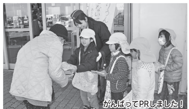
がんばってPRしました!

市役所浅羽支所や園周辺の商業施設に出向いた園児たちは、訪れる人たちに「携帯電話を使いながら運転しないでね」「居眠り運転に気を付けてね」など、交通安全のために注意してもらいたいことを伝えながら3色丸餅と啓発ティッシュを手渡し。受け取った人たちは、園児たちのお願いに「はい、気を付けて運転します」と笑顔で応えていました。