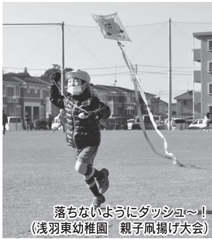
落ちないようにダッシュ〜! (浅羽東幼稚園 親子凧揚げ大会)

1月15日、笠原幼稚園の年長児が、同園区内の休耕田で袋井伝統の丸凧揚げを行いました。また、1月24日には浅羽東幼稚園の年長児が、浅羽北多目的運動広場で親子凧揚げ大会を楽しみました。