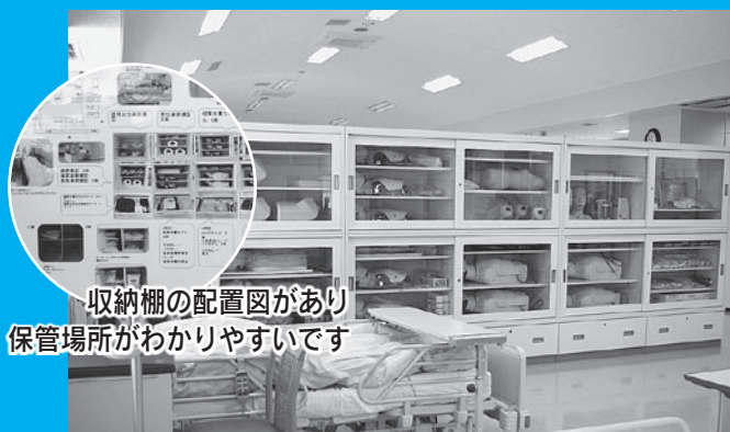
収納棚の配置図があり 保管場所がわかりやすいです