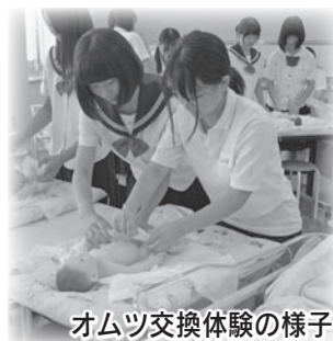
オムツ交換体験の様子

☎(申) 東海アクシス看護専門学校総務課 ☎43-8111 FAX43-8122 ✉ axis-ns01@za.tnc.ne.jp