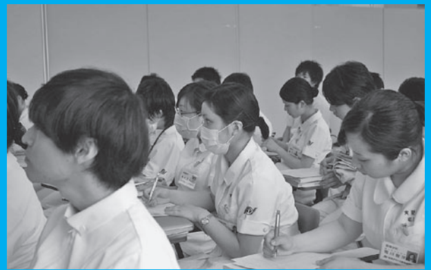
授業を受ける学生たち