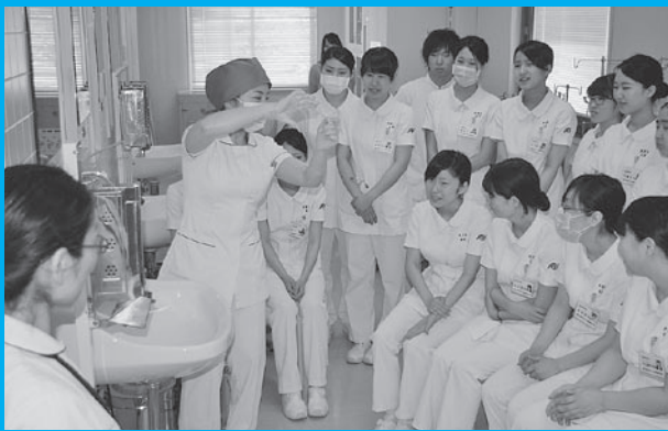
手術前の手洗い方法説明の様子