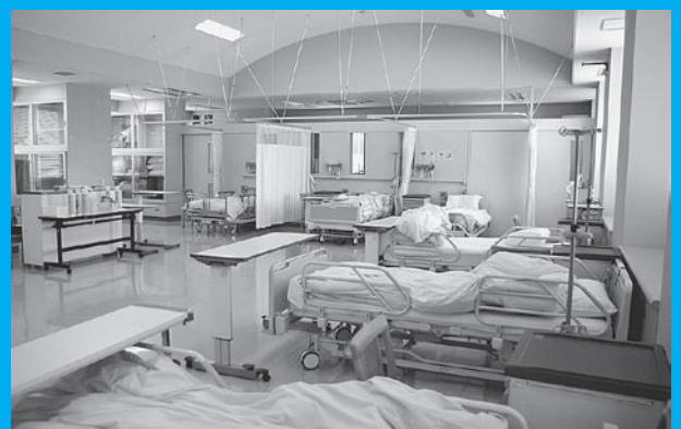
シミュレーションセンター