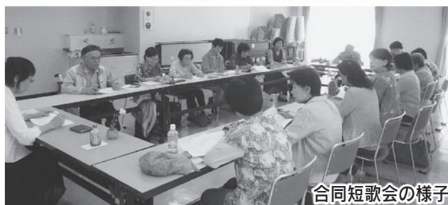
合同短歌会の様子

思ったこと・感じたことを、日記のように短歌にしてみませんか？1人でも多くの方に、短歌という詩型に興味を持っていただけたら幸いです。興味をお持ちの方は、お気軽にお問い合わせください。