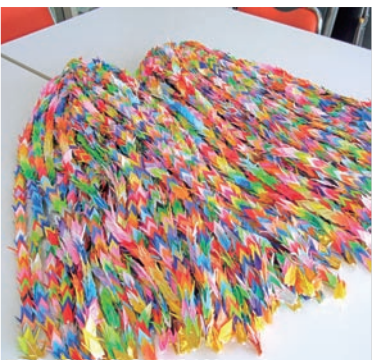
昨年奉納された折鶴

戦争の悲惨さや核兵器の恐ろしさを風化させることなく、平和への思いを次代に継承することは、今を生きる私たちの責務です。袋井市では、市制施行5周年を機に「核兵器廃絶平和都市」を宣言し、平和行政を推進しています。