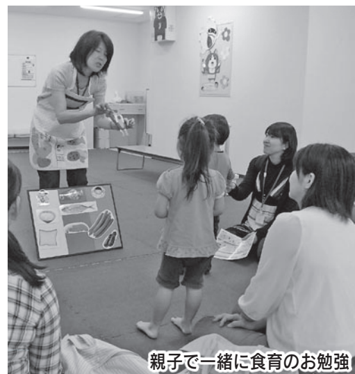
親子で一緒に食育のお勉強