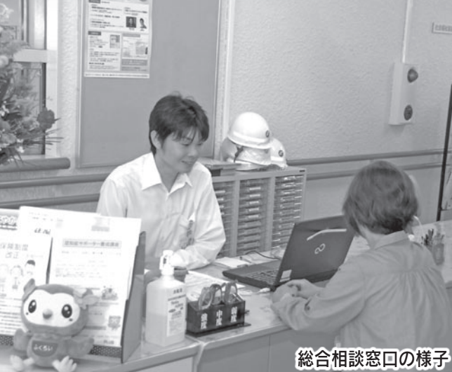
総合相談窓口の様子