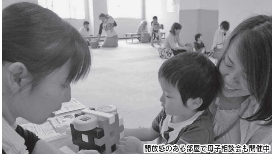
開放感のある部屋で母子相談会も開催中