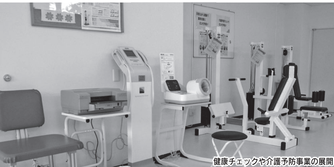
健康チェックや介護予防事業の展開