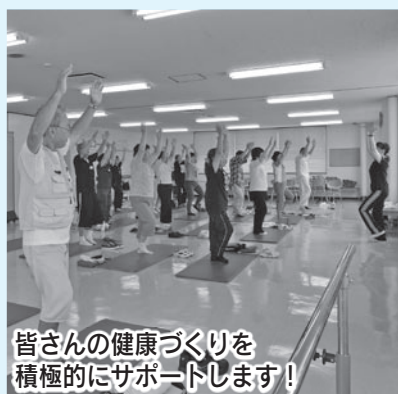
皆さんの健康づくりを積極的にサポートします!