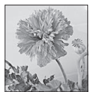
ソムニフェルム種