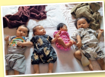
① みんなとこ同士♪似てるかな？

「街の写真館」では、地域やサークルの行事、お気に入りの写真やお子さんの写真などをお待ちしています！ 住所・氏名・電話番号・写真のタイトルと簡単なコメントを書き添えて、郵送・Eメールでお送りください。 送り先 〒437-8666 袋井市役所市長公室広報係 「街の写真館」 hisyo@city.fukuroi.shizuoka.jp